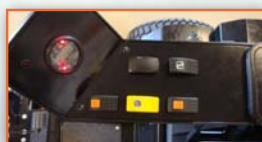
Analogový displej, jednoduché intuitivní ovládání, minimum elektroniky.