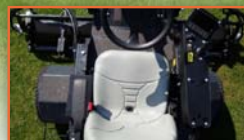
Nově vyvýšená pozice operátora umožňuje snadné nasedání a plnou kontrolu stroje.