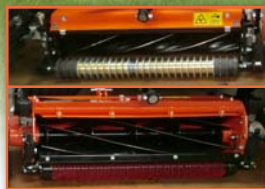
Možnost výběru vřeten: 5, 7 a 11 nožů.